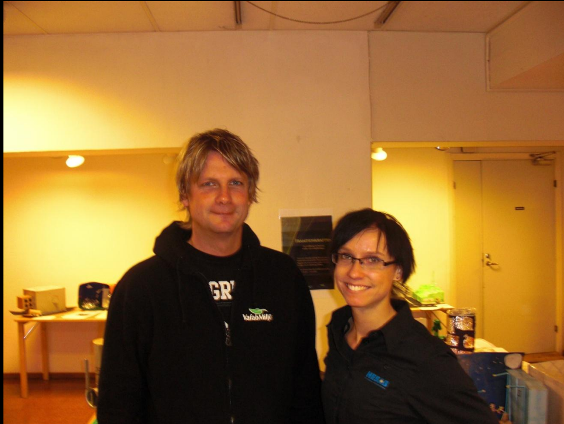
VafabMiljö i samarbete med HESAB